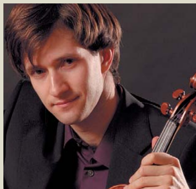
Mikhail Ovrutsky VIOLÍN

el que recibió el Premio Helpmann 2014 a la Mejor Dirección Musical. En 2014 dirigió Kullervo de Sibelius en la Ópera Nacional de Finlandia, con el que inauguró también el Festival de Ludwigsburg 2015. Para Naxos grabó con la Orquesta Sinfónica de Nueva Zelanda todas las sinfonías y varias suites de Sibelius y obras de Rautavaara ❖